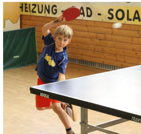
Fotos von den Bezirksmeisterschaften unter http://www.askoe-stoswald.at/